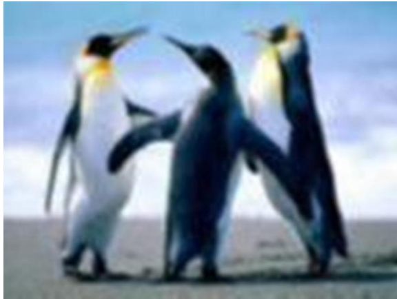
Gambar 2. Contoh gambar dengan resolusi rendah