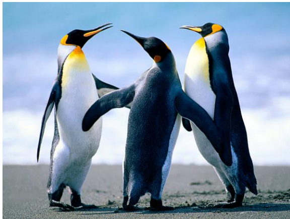
Gambar 3. Contoh gambar dengan resolusi standar