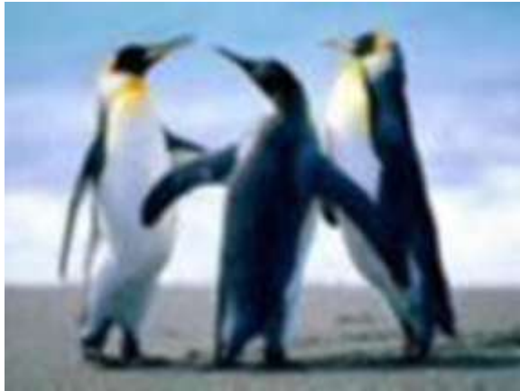
Gambar 2. Contoh gambar dengan resolusi rendah