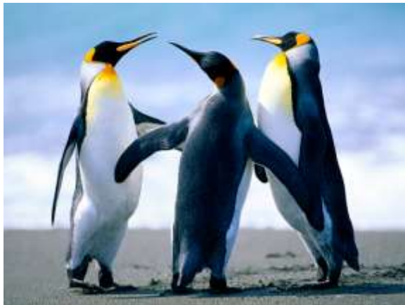
Gambar 3. Contoh gambar dengan resolusi standar